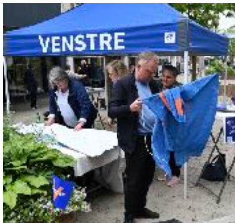
Venstres politiske salgsbod gøres klar

Konceptet er enkelt: Medlemmer og andre interesserede møder ved Rådhuset i Teatergade i Næstved kl. 08.00, hvor der tilbydes kaffe, brød og et politisk oplæg. Første gang den 5. oktober, hvor emnet er det netop indgåede budgetforlig. Derefter fortsætter man til Hjultorvet, hvor Venstres telt sættes op - med tilbud om politik og karameller til publikum.